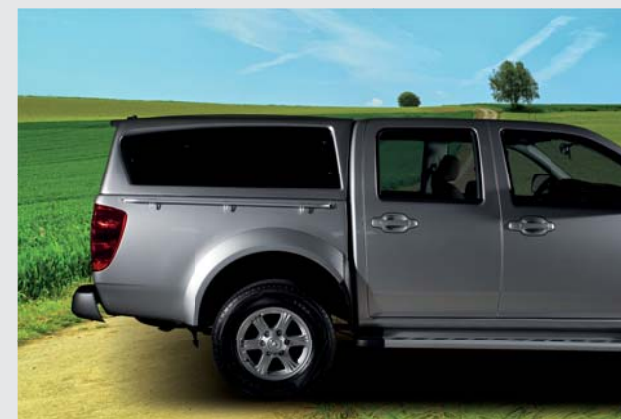
Hard top silver