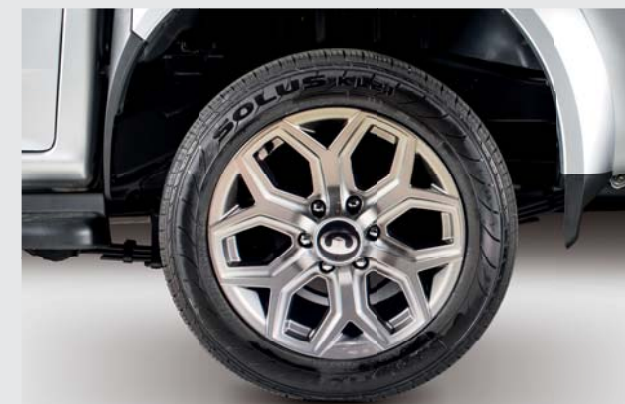
Cerchi in lega diamantato