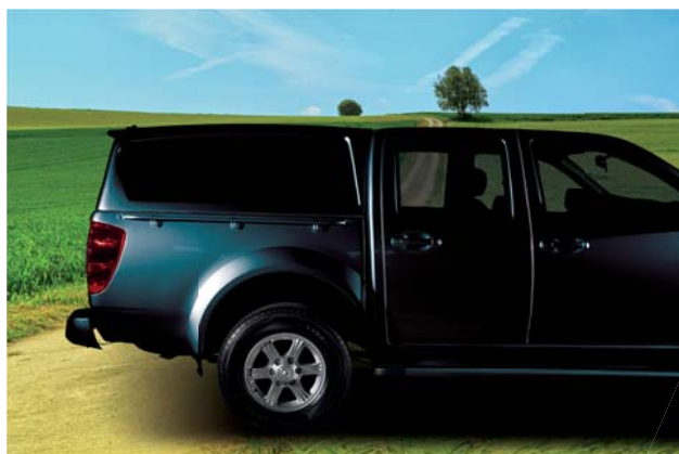
Hard top nero