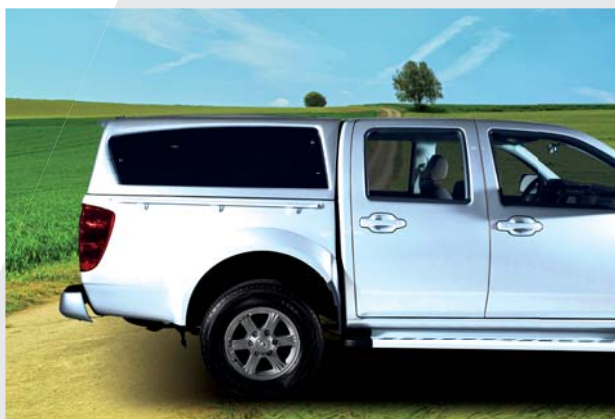
Hard top bianco