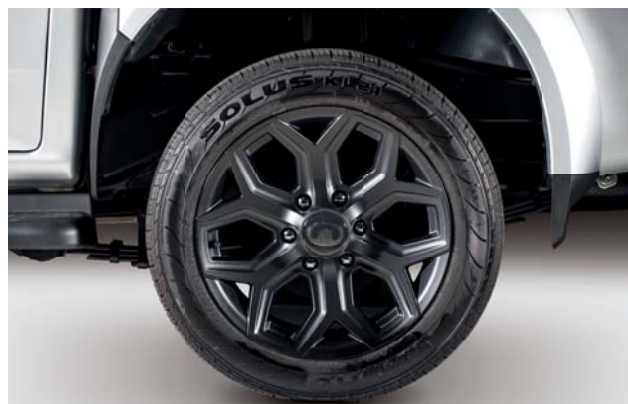
Cerchi in lega black