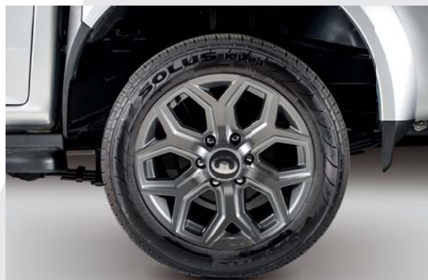
Cerchi in lega titanium